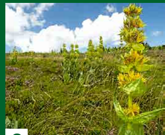
C LA GENTIANE

Les marcaireries étaient propriété de l'Abbaye de Masevaux, puis, après la Révolution des communes de la vallée, les fermiers n'en étaient alors que locataires. Aujourd'hui, ces habitations estivaux ont été transformées en auberges de montagne, ou bien abandonnées à cause de la baisse de l'activité agricole.