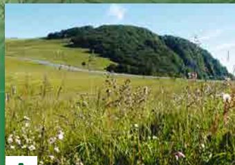
A LE BALLON D'ALSACE

Du haut de ses 1247m, il est le sommet le plus méridional des Vosges, délimitant trois régions et quatre départements. Détrompez-vous: son nom ne provient pas de sa forme arrondie par les âges mais du fait que cette montagne était un lieu de culte celtique dédié au dieu soleil Bel ou Baal. Le circuit vous mène au Wissgrut/Wissgrut, où la vue embrasse la plaine d'Alsace, le Territoire de Belfort et le plateau jurassien, par temps clair il n'est pas rare de discerner les cimes des Alpes et du Mont-blanc à l'horizon.