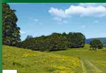
B LES HAUTES-CHAUMES

Du haut de ses 1247m, il est le sommet le plus méridional des Vosges, délimitant trois régions et quatre départements. Détrompez-vous: son nom ne provient pas de sa forme arrondie par les âges mais du fait que cette montagne était un lieu de culte celtique dédié au dieu soleil Bel ou Baal. Le circuit vous mène au Wissgrut/Wissgrut, où la vue embrasse la plaine d'Alsace, le Territoire de Belfort et le plateau jurassien, par temps clair il n'est pas rare de discerner les cimes des Alpes et du Mont-blanc à l'horizon.